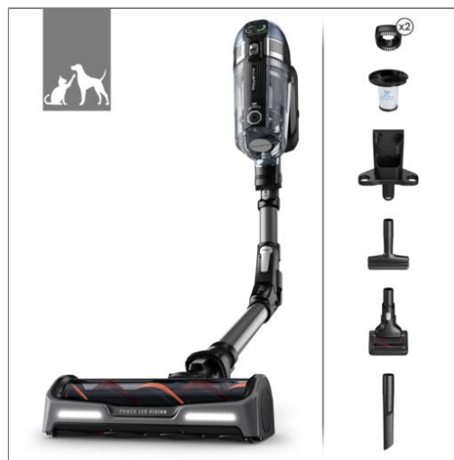
X-Force Flex 14.60 RH99A9 Draadloze Stofzuiger RH99A9W0