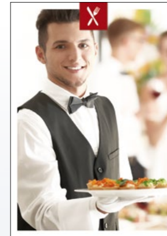
RESTAURANTS / B & B'S