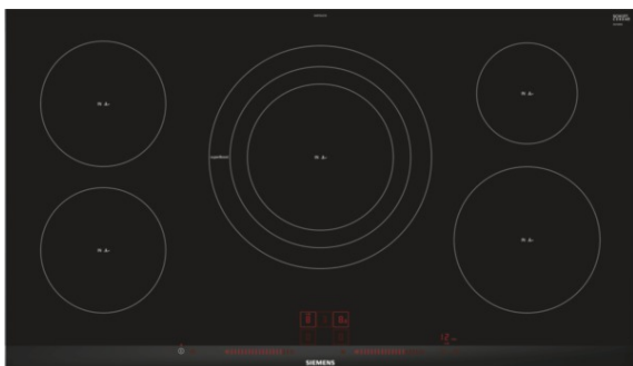
Table de cuisson vitrocéramique à induction - 90 cm Design à facettes